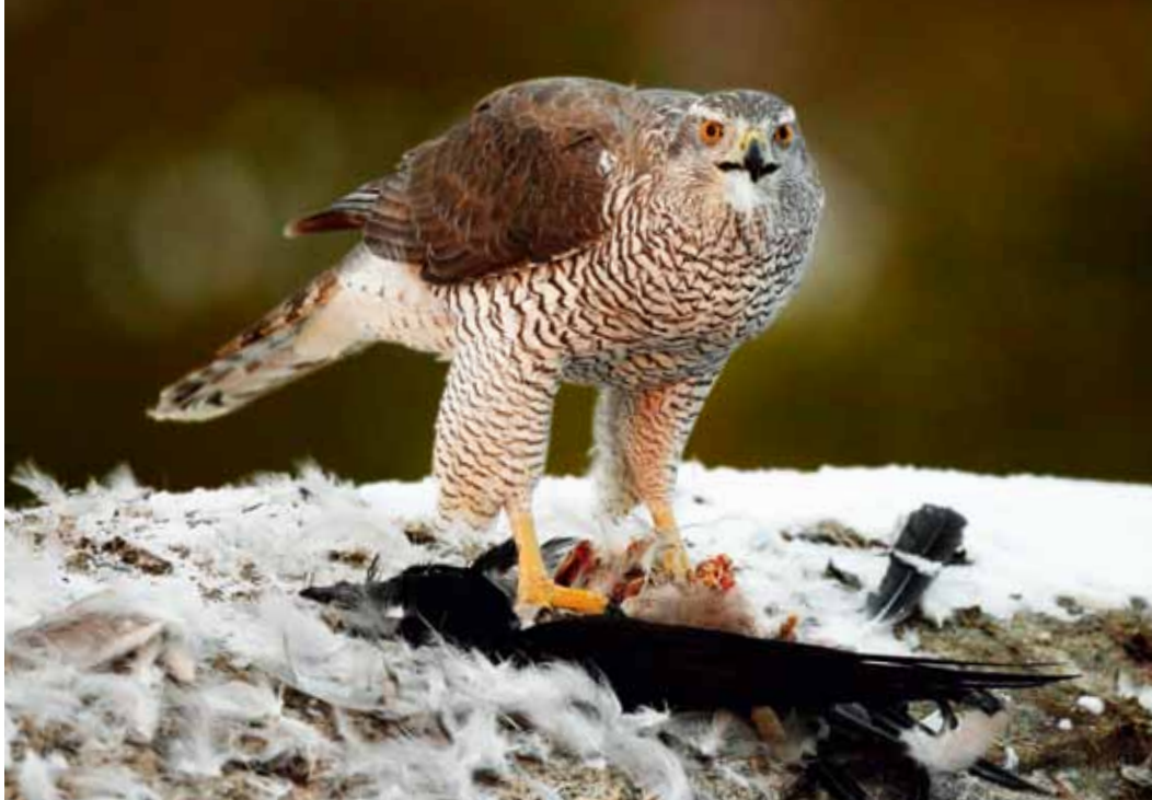
Duehøg plukker en gråkrage.